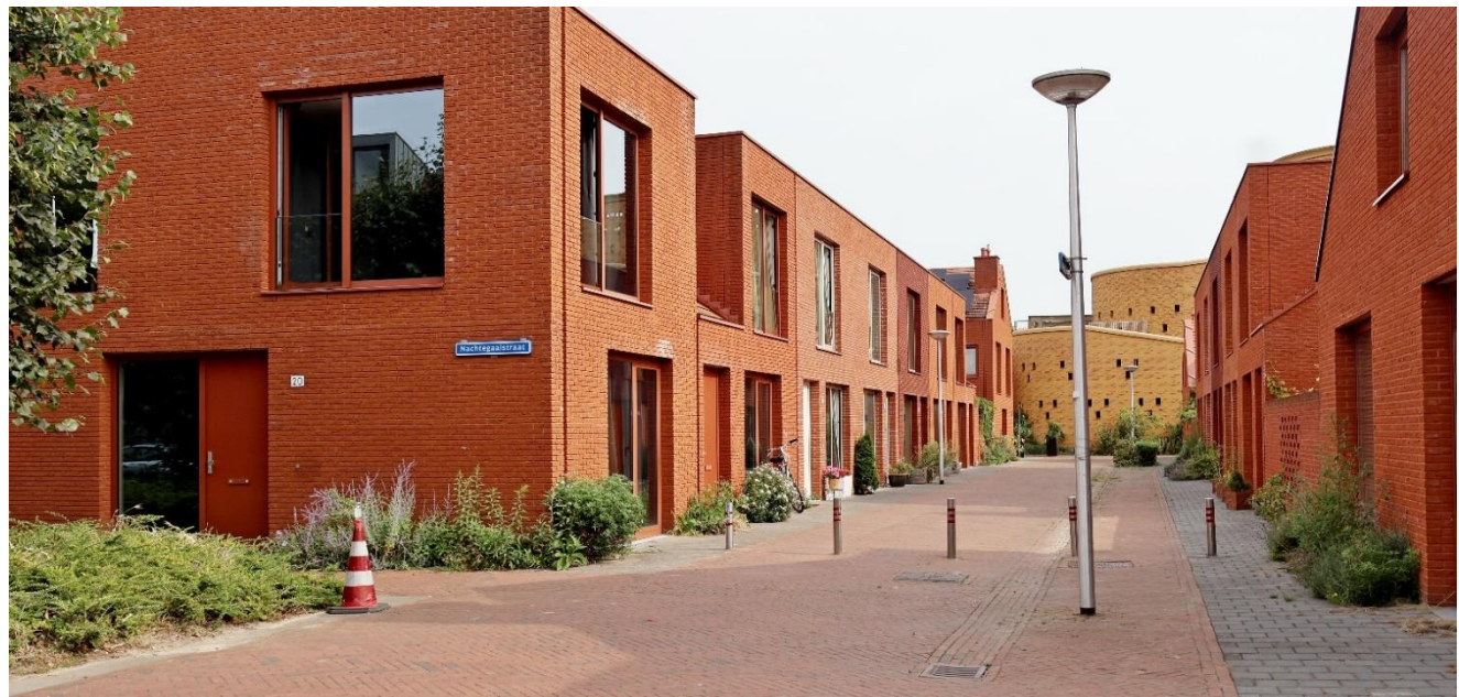
Geveltuinjes in de Vogelbuurt