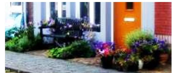
Bloempotten en bloemen tussen de stenen door een individuele bewoner.