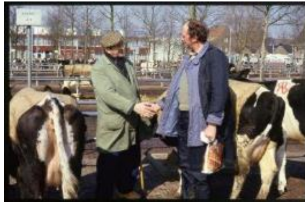
Handjeklap op de Zwolse veemarkt

Bij de Veemarkt werden al in 1935 NSBers aangevallen. Dit was dus al drie jaar voor 1938 toen in de Kristalnacht Joden en hun bezittingen werden aangevallen. In 1934 telde de NSB in Zwolle nog maar 165 leden. Twee aanhangers van de NSB brachten folders rond in de Vogelbuurt (deel van de Kamperpoort). Al snel werden de NSBers met stenen en modder bekogeld. In de Emmastraat was het raak. Eén van de NSBers zakte in elkaar en bleef korte tijd bewusteloos liggen. Vooral in de Vogelbuurt waren er veel socialisten en communisten. En tussen de NSB en deze twee linkse groepen mensen boterde het op zijn zachtst gezegd bepaald niet. Pas veel later in de oorlog waren het in de stad vooral NSBers en andere particulieren die op brute wijze profiteerden van de eigendommen van de weggevoerde Joodse Zwollenaren.