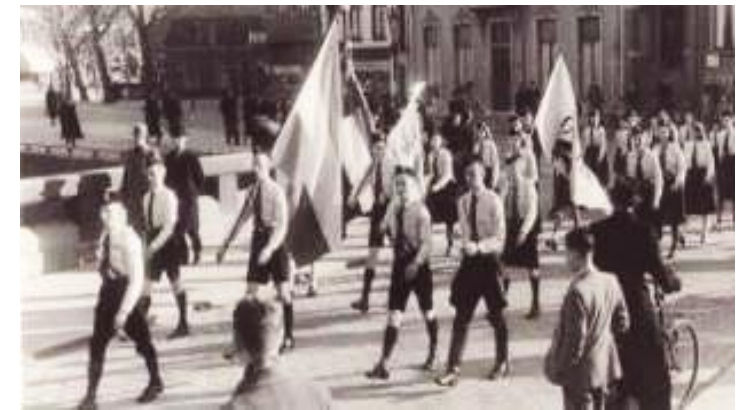
De NSB in 1941 marcherend in Zwolle