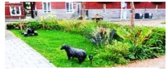
Groen met bloemen en een 'schaap'