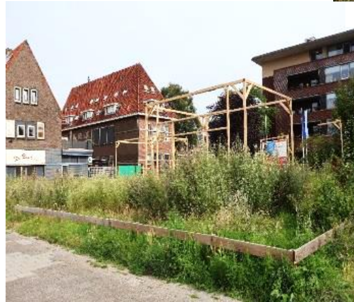
De houten constructies (folly) gezien vanaf Veemarkt 23.