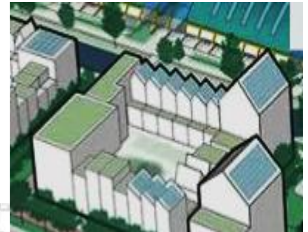
Hoogbouw in het nieuwbouw plan

De Bogenhal wordt een plek waar mensen samenkomen, elkaar ontmoeten en waar ook mensen kunnen eten en drinken en werken. Om de woningen betaalbaar te houden komen er ook hoge flats. .