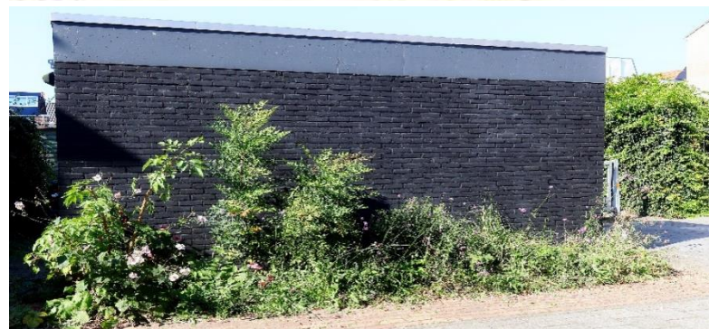
Voorbeeld van vergroening: De Schuur bij Eerste Baan 13. Hierbij de foto's van deze schuur vóór en na de vergroening. Wat is er veranderd?