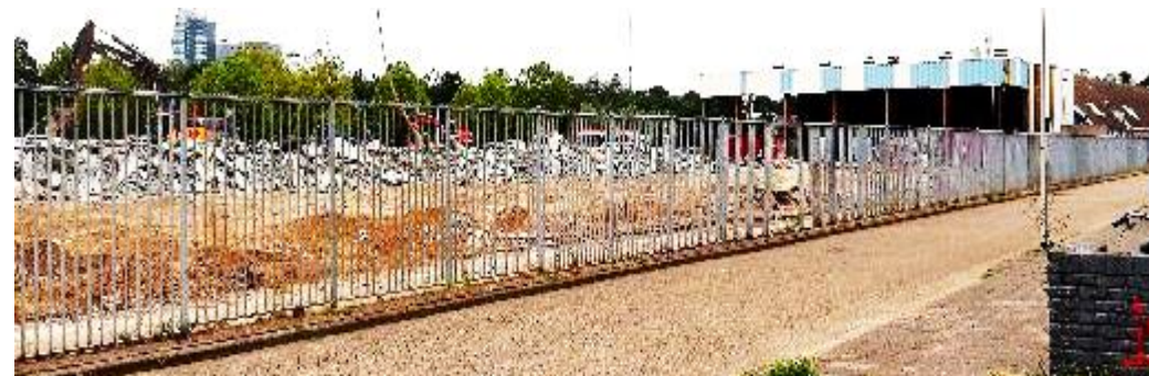
Sloop Veemarkthallen, rechts in beeld staan nog enkele hallen, 25 juli 2021