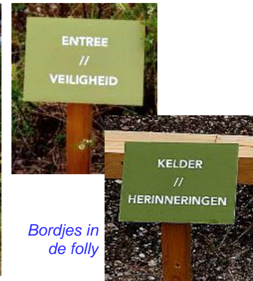
Bordjes in de folly