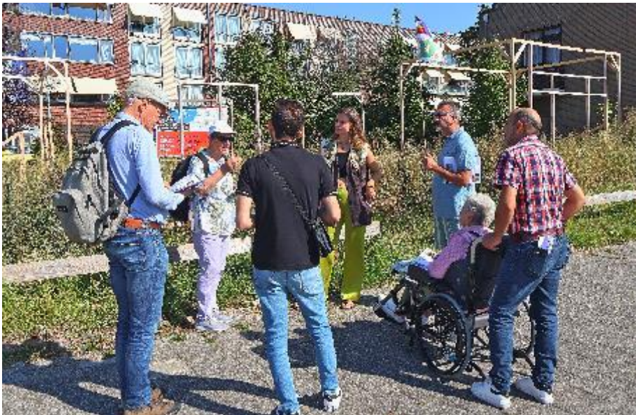
Groepje D voor de folly van Hotel Wijnberg