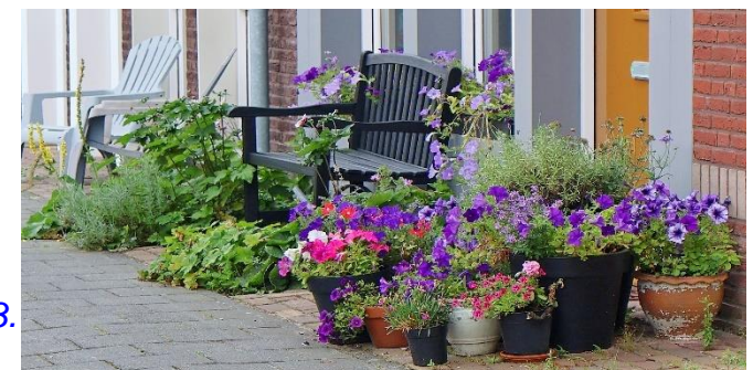
Bloemen in de geveltuin