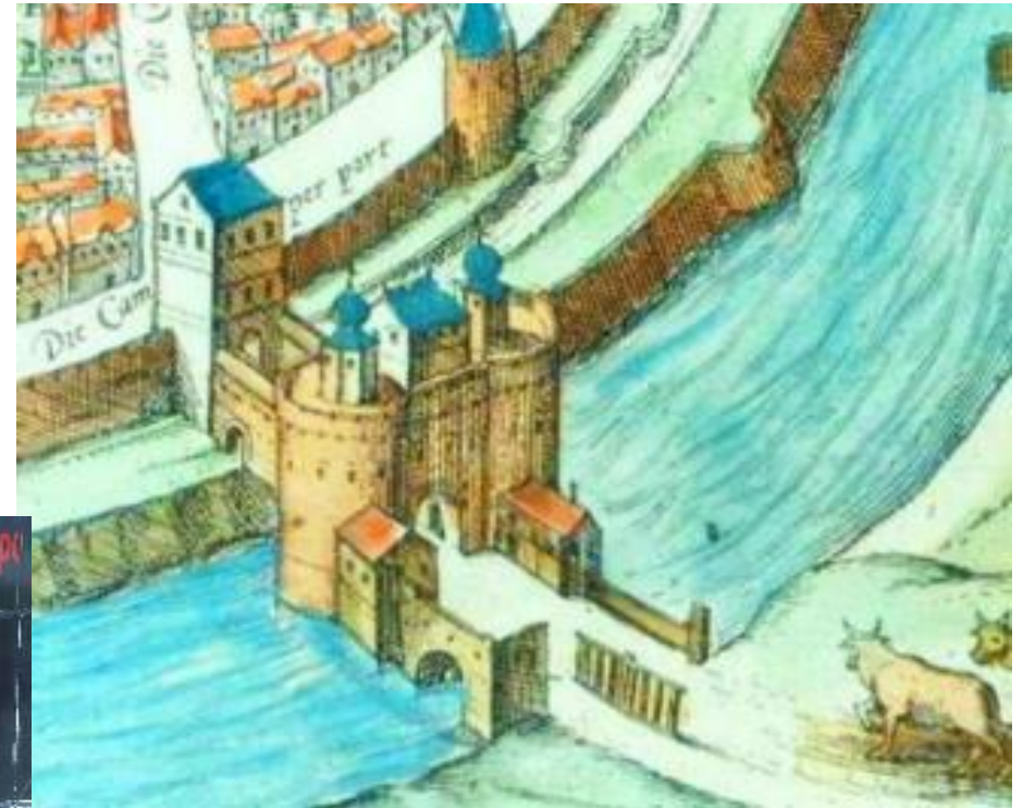
De Kamperpoort op een kaart uit 1630

De poort naar Kampen werd ook wel Voorsterpoort genoemd, omdat het de doorgang was naar het kasteel Voorst dat op de weg naar Kampen lag. Het was een stadspoort in de stadsmuur rondom het centrum van Zwolle, die bestond uit een binnen- en een buitenpoort. De stadsmuur diende als verdediging tegen vijanden zowel adel als bisschoppen. In de middeleeuwen moest een stad wel eerst toestemming van de landsheer of bisschop verkrijgen, voordat een stadsmuur mocht worden gebouwd. De stadsrechten: werden pas later verleend. De ommuring en de imponerende torens op de poort, zoals in de Sassenpoort symboliseerde wel de stedelijke autonomie: erbinnen gold het stadsrecht. De stadsmuren gaven ook de mogelijkheid om belasting te heffen voor hen die de stad wilden binnengaan. 's Avonds gingen deze poorten dicht. Maar men kon dan nog door het kleine poortje dat in de grote deur was verwerkt naar binnen. Vaak moest je dan wel poortgeld betalen.