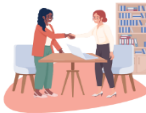
Vrijwilliger bij de ROL

Hulp bij taal is belangrijk, dat helpt om je thuis te voelen. Jij kunt als taalbuddy of taalcoach coach iemand op een laagdrempelige manier Nederlands leren! 'Gewoon doen' is jouw motto. (ook bij Klets en Koek, zie volgende blz.)