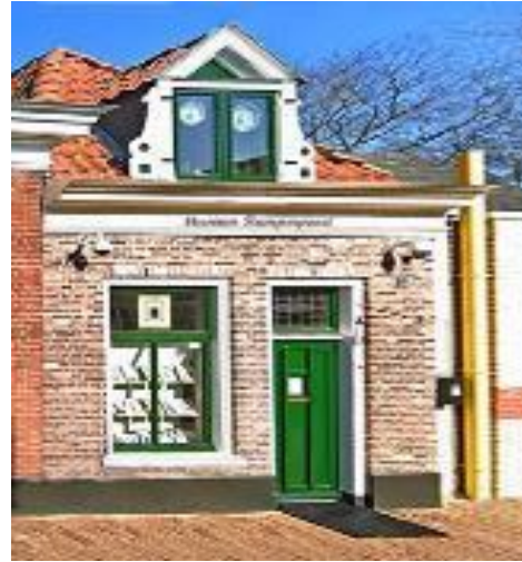
Hoogstraat 88 nu

Sinds 2003 is er het Buurtmuseum van de Kamperpoort gevestigd. Het pandje heeft één verdieping en heeft een dak met rode pannen. Langs de Hoogstraat stonden diverse arbeiderswoningen en kleine buurtwinkeltjes. De eigenaar verhuurde het pand aan o.a. een schoenmaker, een kuiper, een barbier en schoenmaker. Het was in die tijd gewoon dat men meerdere beroepen uitoefende.