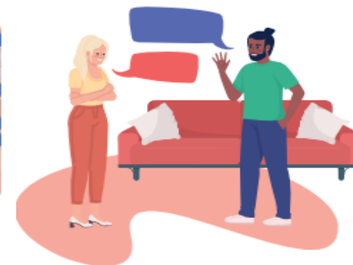
Taalles geven is waardevol voor de vluchteling en de vrijwilliger