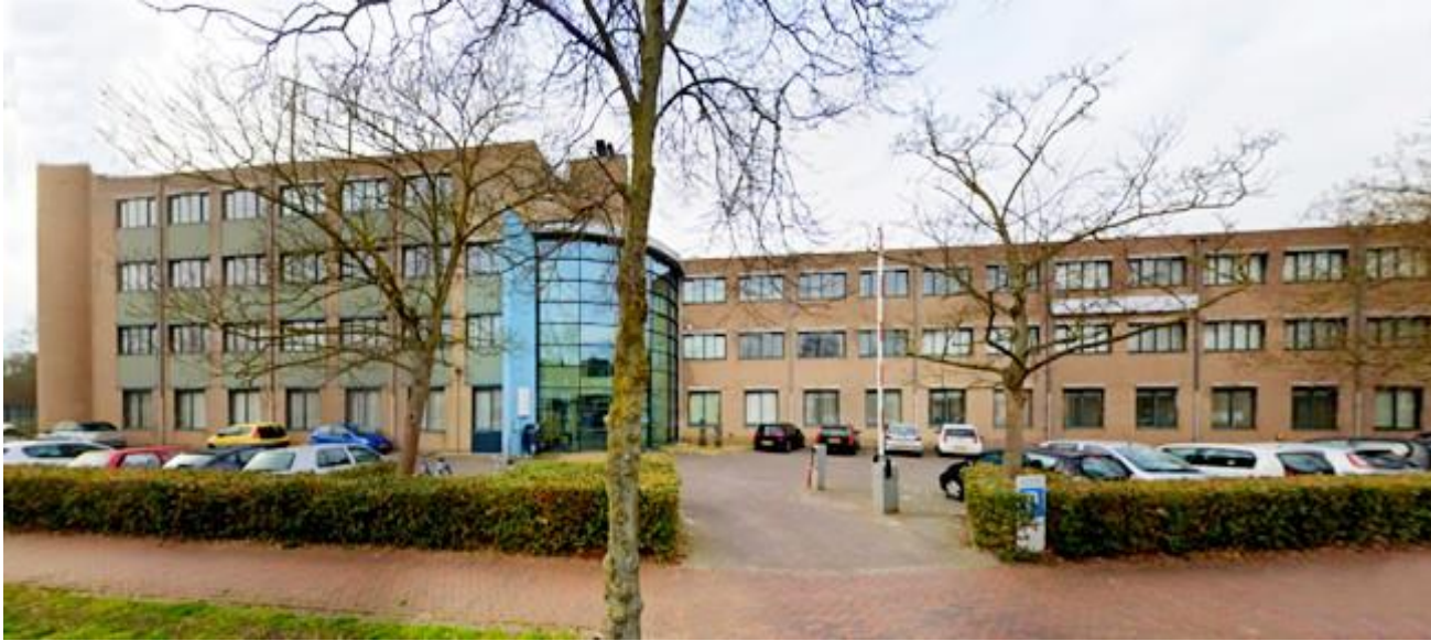
.De Regionale Opvang-Locatie voor vluchtelingen aan de Meeuwenlaan in de Kamperpoort. Hier is nu ook Vluchtelingenwerk ondergebracht

mensen op de vlucht, van hen hebben ruim 21 miljoen hun land verlaten. Vluchtelingen zijn kwetsbaar. Daarom hebben zij extra bescherming nodig.