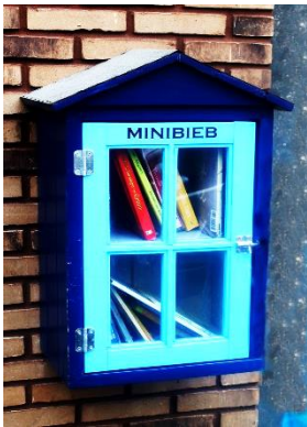
Minibieb: Boeken gratis lenen

We bekijken de groentetuintjes, geveltuintjes, en fruituintjes, speelveldjes met groen er om heen, bloembakken, boombakken. Ook in de Vogelbuurt. Minibieb's zijn er vanuit de idee dat het zonde is om boeken in de kast te laten verstoffen en dat het delen van boeken iets ontzettend moois is. Lezen is een groot goed en door boeken te ruilen en delen met de hele buurt ontstaat er een positieve ontwikkeling zowel voor de buurt als voor het lezen.