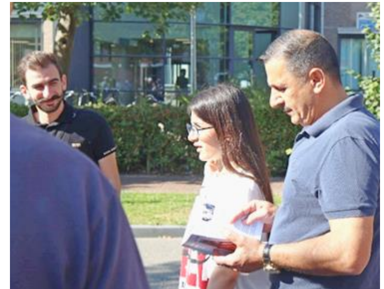
Vader en dochter vertellen hun vluchtverhaal aan groepje D voor het gebouw van de ROL