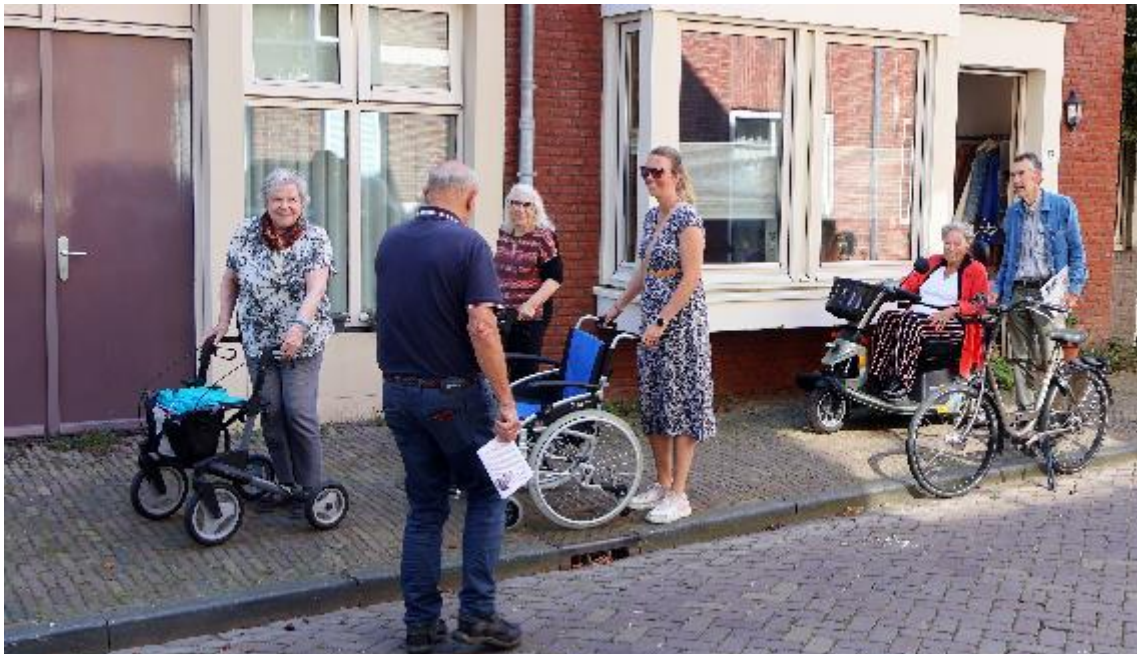
Groepje C in de Hoogstraat, de vroegere hoofdstraat van Zwolle naar Kampen

Op 21 maart 1294 werd het kasteel belegerd door de steden Deventer, Kampen en Zwolle en een grote groep ridders, waaronder de heren van Almelo, Kuinre en Buckhorst. Door tussenkomst van Reinoud I van Gelre werd het beleg afgebroken.