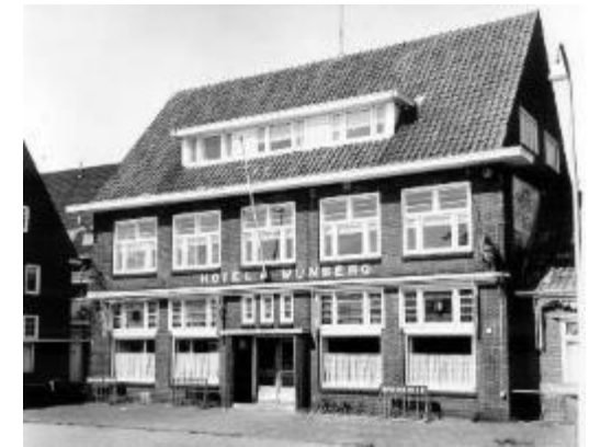
Hotel Wijnberg in 1973