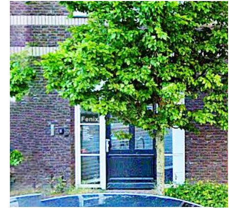
Gezondheidscentrum De Fenix, Lijnbaan 12

gezondheidscentrum (zie afbeelding) herinnert aan deze fabriek. Later zou men juist de grotere industrie uit de wijk Kamperpoort gaan weren. Alleen voor kantoren was nog plaats. Door zijn functie als weg naar Kampen en de Mastenbroekerpolder kende de Hoogstraat op de Zwolsche marktdagen veel verkeer. De boeren uit de polder dreven dan hun vee ter markt en kwamen door de wijk. De veemarkten verplaatsten zich naar de Harm Smeengekade (koeien) en Pannekoekendijk (varkens). Meer dan honderd jaar zou het vee hier verhandeld worden. In 1931 werd de Veemarkt in gebruik genomen, die nu al weer is afgebroken en waar nieuwbouw is gepland. Op: https://buurtmuseum-kamperpoort.nl/geschiedeniskamperpoort.htm staat nog veel meer van de geschiedenis.