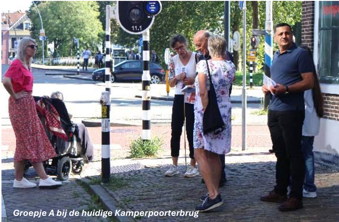
Groepje A bij de huidige Kamperpoorterbrug

De Kamperpoort werd voor het eerst vermeld in 1364. In 1482 werd de poort versterkt met twee grote ronde hoektorens. De woonwijk aan de buitenkant van de stadsgracht is vernoemd naar deze poort: de Kamperpoort.