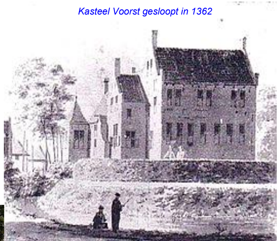
Kasteel Voorst gesloopt in 1362

In juli 1324 stichtten de heren van Voorst brand in de stad Zwolle. Er bleven slechts negen huizen over. De bisschop van Utrecht steunde de steden. Ook in de nacht van 14 op 15 oktober 1361 werd Zwolle in brand gestoken. Ditmaal omdat heer Zweder van Voorst, kwaad was over een kanaal en ook omdat hij geen deel zou krijgen bij de verdeling van de drooglegging van Mastenbroek.