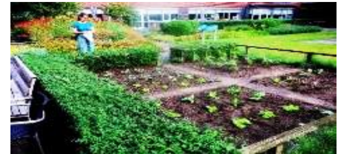
Groentetuin bij de Nieuwe Haven