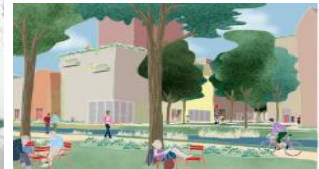
Sparzaam groen in het nieuwbouw plan