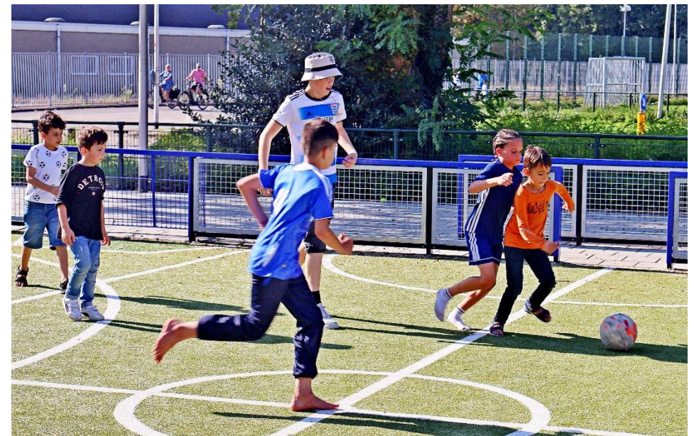
Op het plein van de Elbertsschool een mooi speelveld voor kinderen uit de buurt. Vluchtelingenkinderen uit de ROL en buurtkinderen