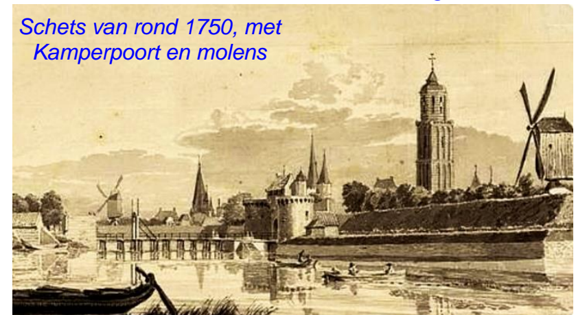
Schets van rond 1750, met Kamperpoort en molens