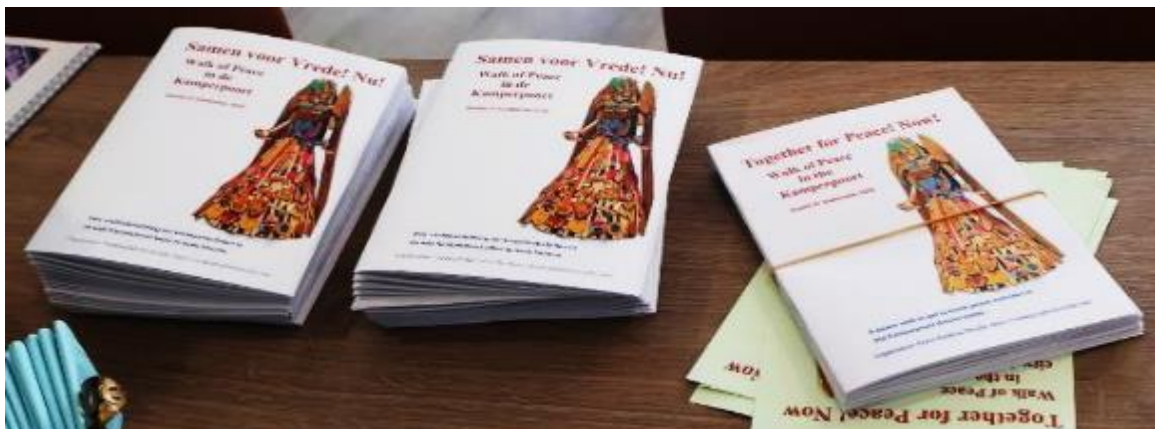
Het routeboekje met informatie over de wijkbewoners en de wijk.