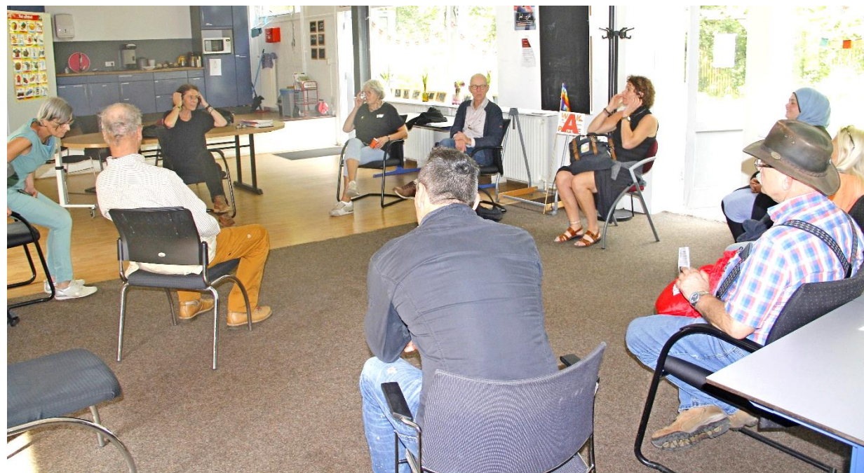
2021 Walk of Peace in de Dieze-wijk op bezoek bij Vluchtelingenwerk