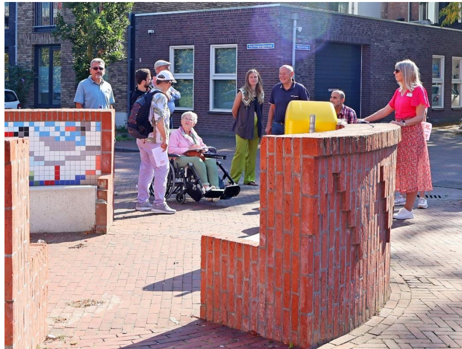
.Groepje D bij de mozaïekbank op het plein voor het Wijkcentrum

Poster over Bak100 festival eindpunt van de Walk of Peace