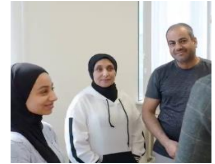
Vluchtelingen tonen hun dankbaarheid in de ROL

spreekt de klankbordgroep over de verkeerssituatie op de Meeuwenlaan. Op de Open azc dag zetten veel asielzoekerscentra tussen 13.00 en 16.00 uur hun deuren open voor iedereen die nieuwsgierig is hoe het is om hier te wonen en te werken. Er zijn rondleidingen, informatie-markten, workshops en andere leuke activiteiten. De Open azc dag is op Nationale Burendag. Daar-mee benadrukken we dat asielzoekers burens van iedereen zijn! Door de enorme toename van het aantal alleenstaanden in Nederland (van 3 honderd duizend in 1947 naar 3,3 miljoen in 2024 is er enorm gebrek aan woningen, dus lange wachttijden voor alleenstaanden, voor nieuwe en oude Nederlanders!