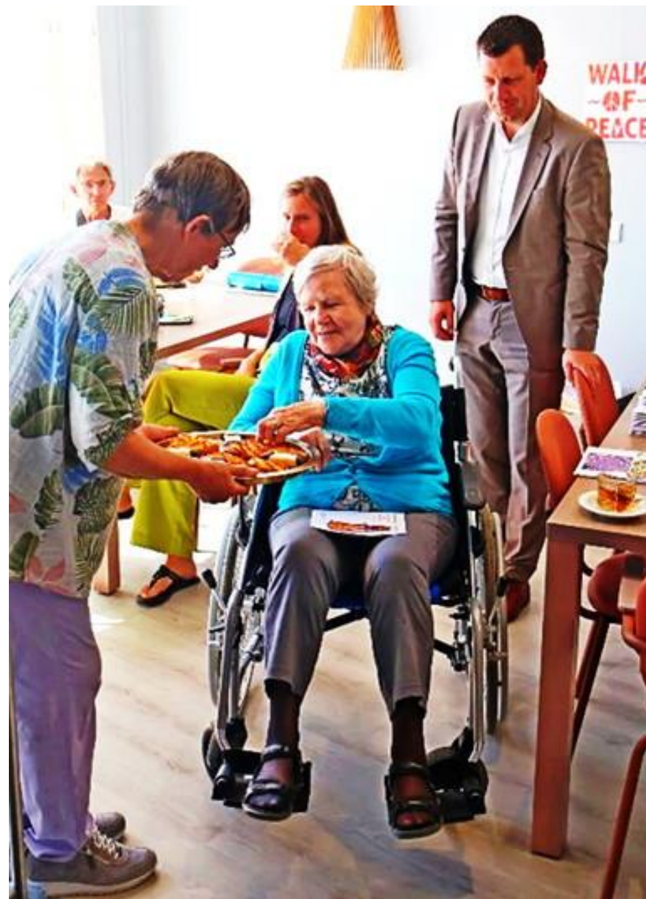
Ontvangst van de deelnemers in het verzorgingstehuis 'de Nieuwe Haven' gebak, thee, koffie