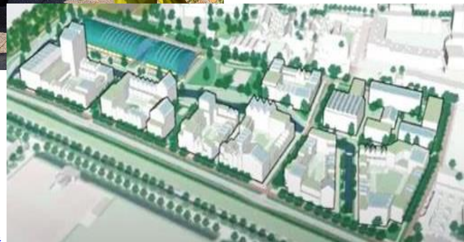
Nieuwbouw plan van de Veemarkt