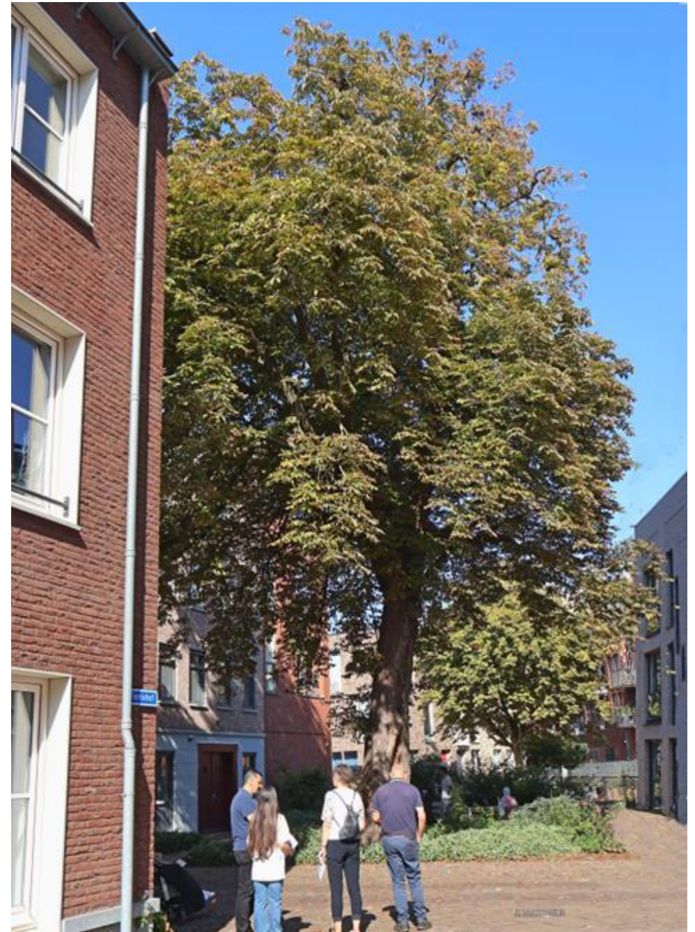
Fenixhof (tussen Hoogstraat en Lijnbaan) met kastanjeboom, groepje D

Er waren twee scholen, de RK St. Antoniuschool aan de Grote Baan (1931-1932), waarin nu appartementen woningen zijn en de Egbertsschool, aan de Lijnbaan/Veemarkt. Deze laatste dient nu als school voor Nieuwkomers aan vluchtelingenkinderen uit de Regionale Opvanglocatie aan de Meeuwenlaan.,