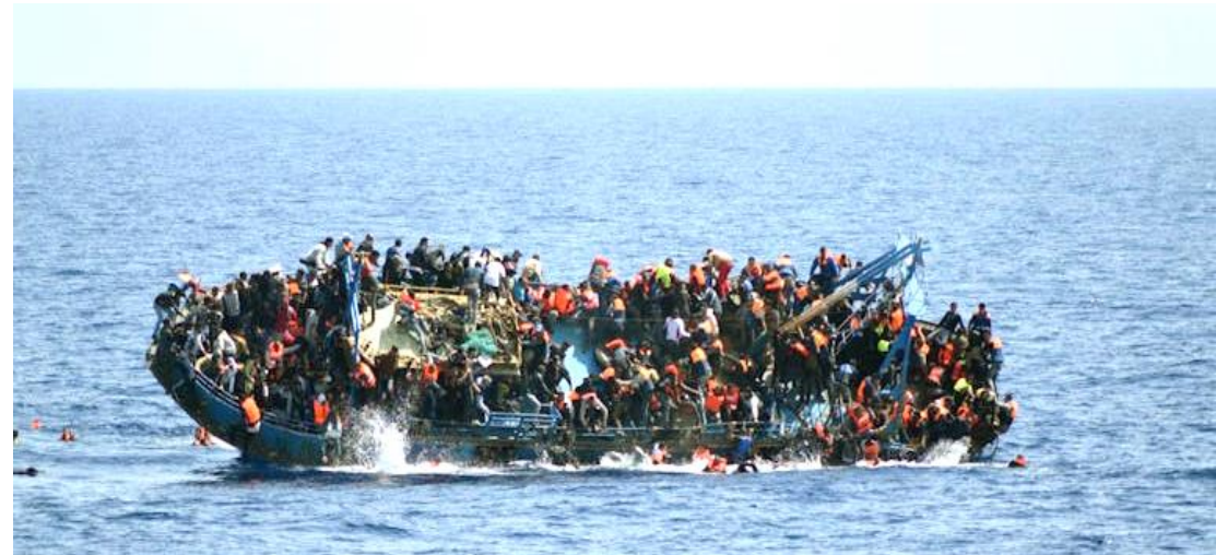
Migranten op een overvolle boot in de Middellandse Zee in mei 2016. Rond 500 van hen werden gered door de Italiaanse marine, die ook 7 stoffelijke

Elke dag nemen overal ter wereld mensen de moeilijkste beslissing in hun leven: ze besluiten hun huis te verlaten in de hoop elders een beter leven te kunnen leiden. Wereldwijd zijn meer dan 68 miljoen