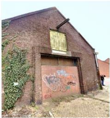
2) 21 september 2024 resultaat van vergroening

Deze twee foto's laten een mooi voorbeeld zien van hoe deze vergroening gaat: